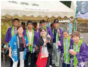
▲ 豊永ふれあい特産品まつり