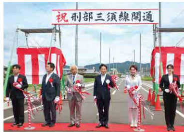
▲ 刑部三須線開通式