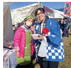
▲ 勝北ふるさとまつり