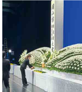
▲ 岡山市戦没者追悼式