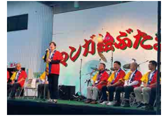
▲ マンガ絵ふたまつり