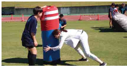
▲ つやまスポーツフェスティバル