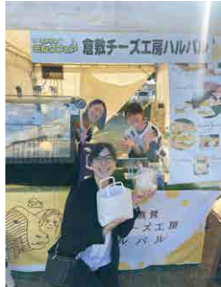
▲ おかやまミルクフェア