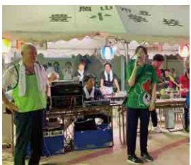
▲ とよふれあいまつり