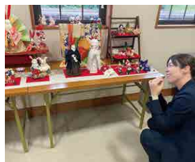
▲ 落合まちかど展覧会