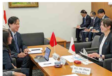
▲ ベトナム議員の表敬