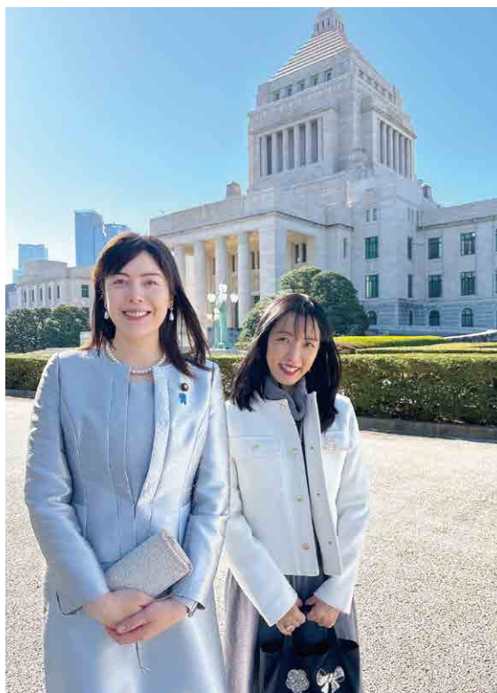
▲ 天皇陛下お迎え時、秘書と共に