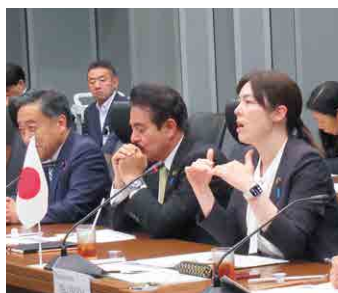
▲ フランス議員団と意見交換