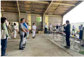
▲ おからく瀬戸内ホルスタイン共進会