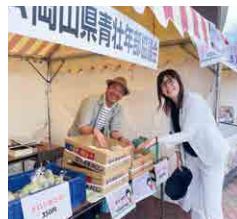
▲ 足守メロン大人気