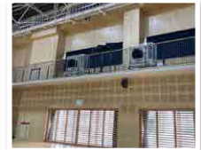
災害時にも利用可能な学校体育館の空調設備