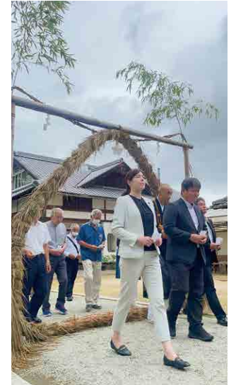
▲ 安仁神社茅の輪神事