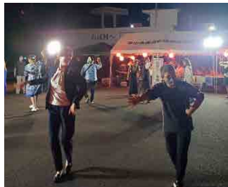
▲ 阿波ふるさとふれあい納涼星空祭り