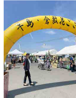
▲ 早島・倉敷花ごぞまつり