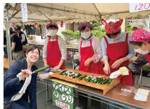
▲ 神目ぼたるまつり