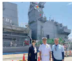
▲ 玉島ハーバーフェスティバル